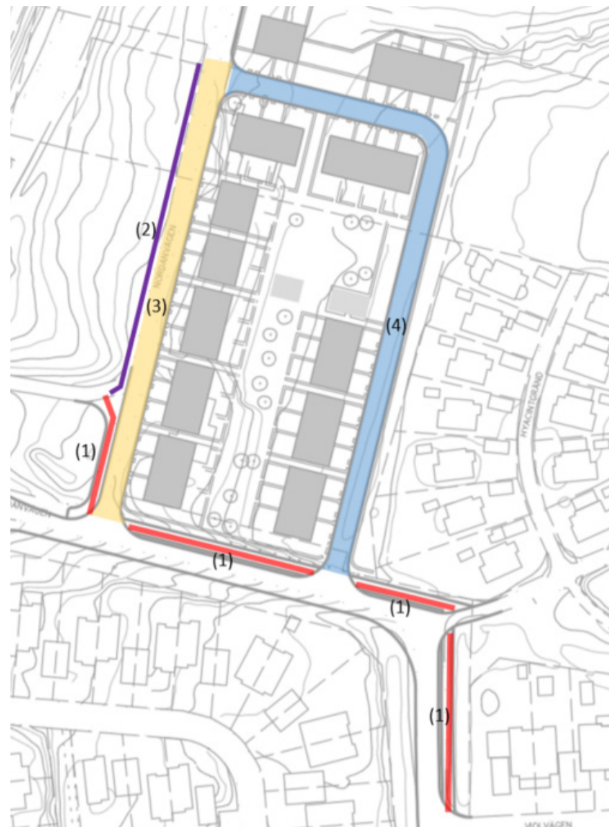
(1) och (2) Ny gång- och cykelbana. (3) Ny asfalterad gata där befintlig grusad väg ligger. (4) Ny lokalgata genom området.