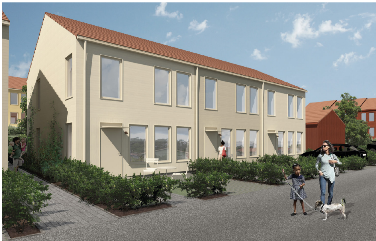
Illustration över ny bebyggelse, Forslunds Arkitekter. I planbeskrivningen s. 10 beskrivs gestaltningsambitioner.