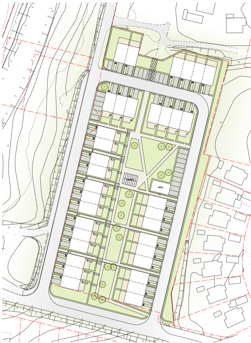
Förslag till struktur för området, Forslunds Arkitekter.

Del av Nordanvägen som idag utgör en grusad väg utefter västra delen av planområdet byggs om och asfalteras. Då detta är ett viktigt stråk för barn som ska ta sig till och från närliggande skolor bör gående och cyklister ej blandas med bilisterna. En separat gång- och cykelbana anläggs därför parallellt med körbanan. Där planområdet slutar i norr övergår Nordanvägen till sin befintliga karaktär med grusad markbeläggning.